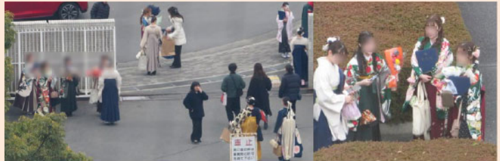
↑卒業式(学位授与式)が終わってからの写真です。みなさん、きれいに着飾っておられます。一世一代の晴れ姿です。

翌13日は千里金蘭大学の学位授与式、卒業式。学生達は着飾っていました。きれいでしょう？まあ、きれいですよ、でした。夜は梅田スカイビルでの卒業パーティに参加。ビンゴゲームで私は2等賞(松阪牛1万円分)！しかし、教官がもらってはいけません。ここで「運」を使ってはいけません。学生達にプレゼント。20人ほどの学生がじゃんけん。わずか2回で決まってしまうました。もっと盛り上がりたかったのに。簡単に決まり過ぎ！