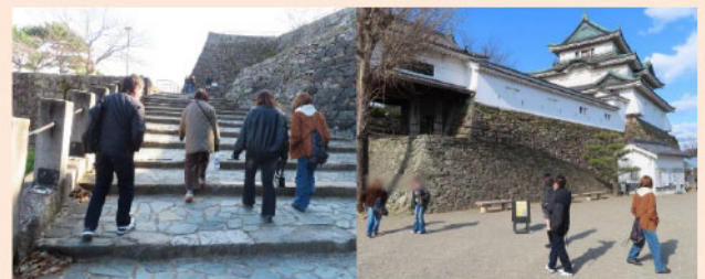
↑和歌山城へ行きました。いい天気でしたが、寒かった。石段をのぼって天守閣へ。学生さんたち、しんどい、しんどい、と言いながら登っていました。私のほうがはるかにスタスタと上っていましたよ。