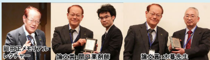
岡田正メモリアル レクチャー