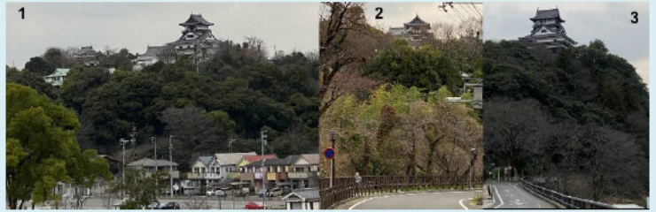
↑ 国宝犬山城です。いろいろな角度から撮影しました。小高い山の上にある天守閣なので、いろんな角度から見るができます。右端の写真は、木曾川の畔、愛知県側からの撮影です。