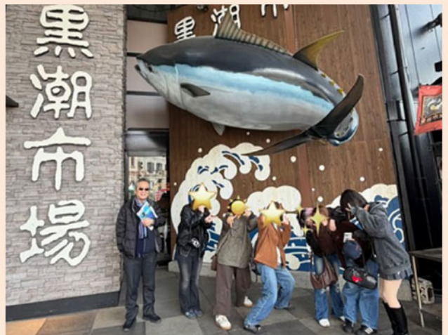
↑黒潮市場で記念写真。学生さん達のお顔を出してはいけないということで、こういう写真になりました。左端のいかついおっちゃんが、私です。金蘭会という組の方ですか？でした。