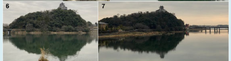
↑ 木曾川にかかるライン大橋を渡って、対岸に行き、写真撮影。4の写真は屋形船です。7の写真にはライン大橋が写っています。