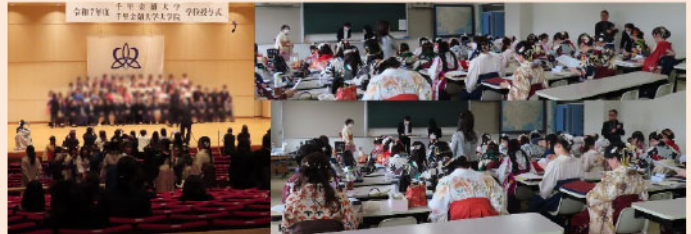
↑左は学位授与式後の、学部毎の記念写真。右は栄養学部の学生達が事務連絡などのために集まっているところ。担任の先生達からの挨拶がありました。卒業、おめでとう！

15日の日曜日は今年度最後のオープンキャンパス。今回は参加者がかなり多くて、よかったです。参加者には近くの有名なケーキ屋さん：デリチユースのチーズケーキをプレゼント(1個700円)。参加した生徒さん達、非常に喜んでいました。おこぼれは、なし。私は、朝からずっと会場をうろうろ。ほぼ6時間うろうろ。役に立ったのかなあ。